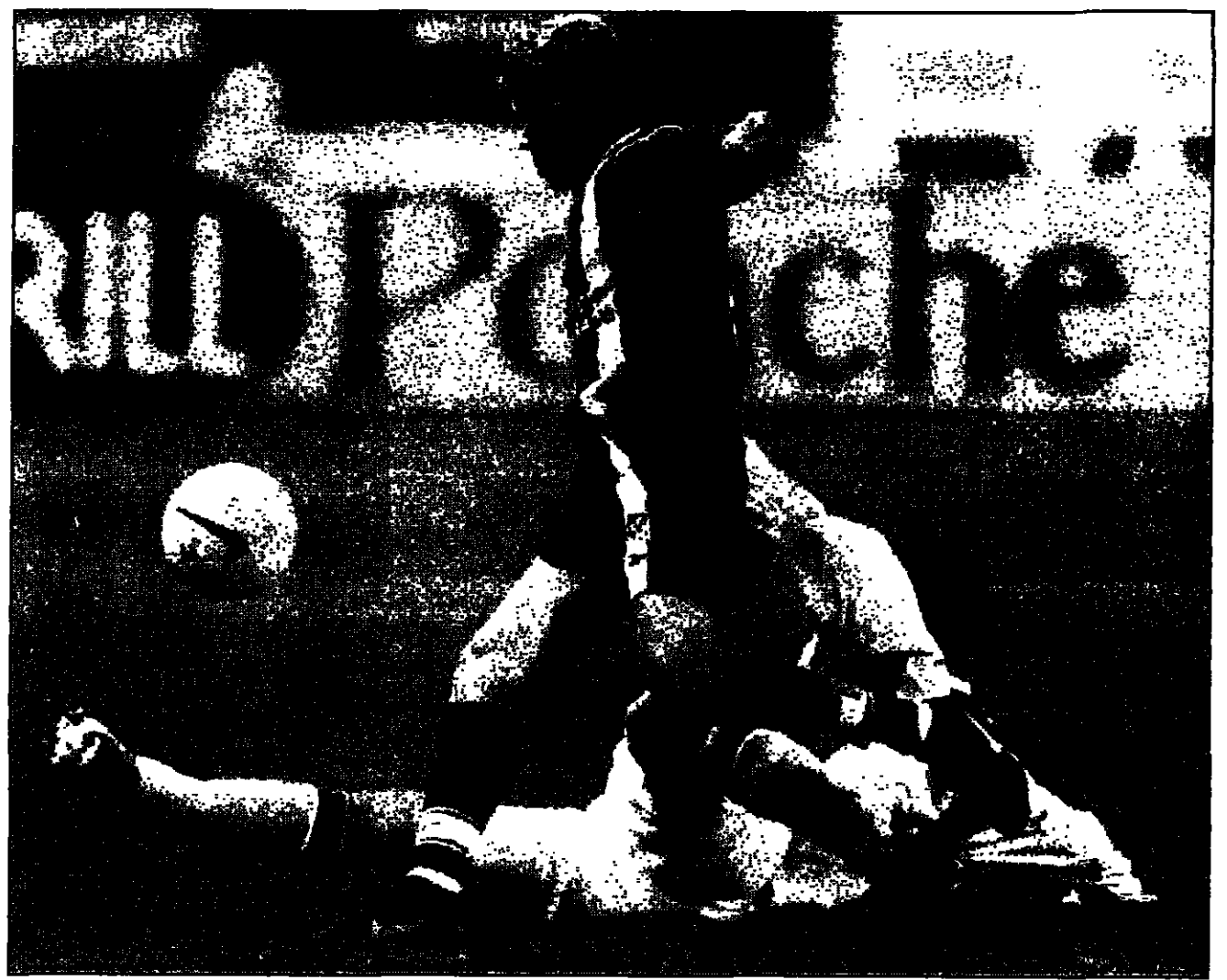
لاعب ألبانيفيك مودريه جيلانيو يتقدم بالكرة